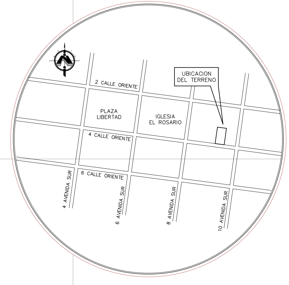
ESQUEMA DE UBICACION SIN ESCALA